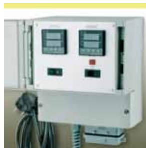
Elektr. Regler-Begrenzerkombination KM-RD3000