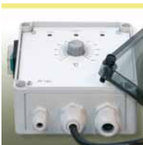
Elektronischer Temperaturregler KM-EC210

Zur Temperaturregelung empfehlen wir unser Programm an elektronischen Steuer- und Temperaturregelgeräten sowie die entsprechenden Temperaturfühler.