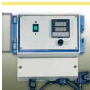
Elektronischer Temperaturregler Serie KM-RD1000